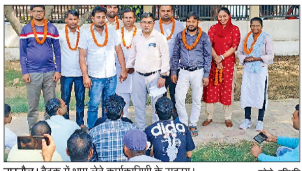
नारनौल। बैठक में भाग लेते कार्यकारिणी के सदस्य।