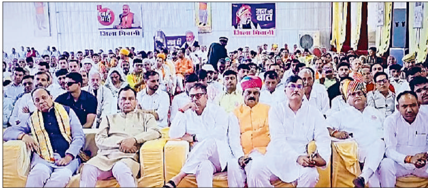
भिवानी। पीएम नरेंद्र मोदी के मन की बात सुनते नेता।