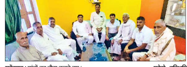
महेंद्रगढ़। गांवों का दौरा करते हुए।