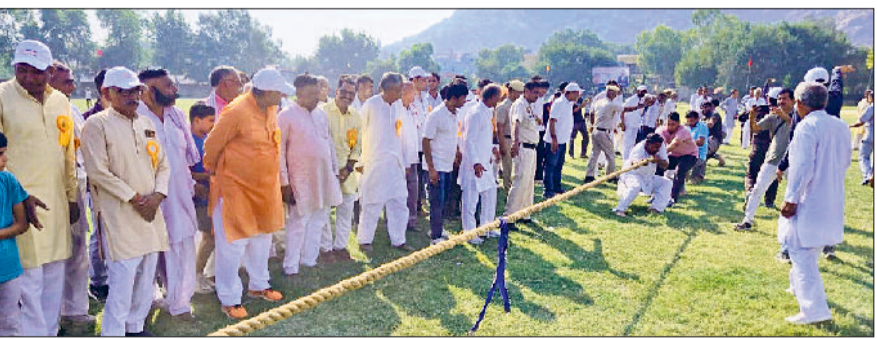
तोशाम। 26 बीडब्ल्यूएन:19: रस्साकसी प्रतिस्पर्धा देखते सांसद धर्मवीर सिंह।

सांसद धर्मवीर सिंह ने कहा कि खेल प्रतिभाओं को आगे बढ़ाने के लिए कई पहल की जा रही हैं। इस कड़ी में सांसद खेल महोत्सव ग्रामीण क्षेत्र की प्रतिभाओं को मंच उपलब्ध करवाने का अहम कार्य करेगा। सांसद ने कहा कि आज हरियाणा देश की सबसे बड़ी खेल ताकत के रूप में उभरा है। सरकार ने खिलाड़ियों के लिए अनुकूल माहौल तैयार करते हुए उनकी प्रतिभा को नई दिशा प्रदान की है। खिलाड़ियों से संवाद करते हुए सांसद ने कहा कि खेलों के माध्यम से अनुशासन, समर्पण एवं दृढ़-संकल्प के साथ प्रदेश का भविष्य