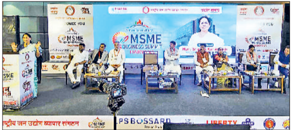
भिवानी। समारोह को संबोधित करती एक वक्ता।

केंद्रीय सूक्ष्म, लघु और मध्यम उद्यम मंत्री शोभा करदलाल ने कहा कि एमएसएमई में कुछ भी बनाएँ, हमारा लक्ष्य एक्सपोर्ट के लिए क्वालिटी की चीजों का उत्पादन होना चाहिए। विदेशों में नेचुरल और फर्टिलाइजर रहित चीजों की डिमांड है। इसका हमें ध्यान रखना होगा। साथ ही उन्होंने कहा कि देश के छोटे उद्योगों को बढ़ावा देने के लिए प्रधानमंत्री नरेंद्र मोदी काम कर रहे हैं। यह बात उन्होंने रविवार को यहां लीला होटल में राष्ट्रीय जन उद्योग व्यापार संगठन की ओर से आयोजित एमएसएमई बिजनेस समिट एवं उद्यम अवार्ड समारोह को संबोधित करते हुए कही।