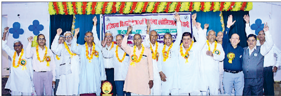
बिजली पैशनर्ज को सम्मानित करते अतिथि।