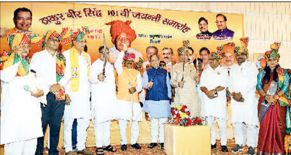
भिवानी। आयोजित कार्यक्रम में मंगारीन नेता।