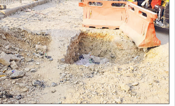
भिवानी। सामान्य अस्पताल के पास धंसी सड़क का दृश्य व दिनोद गेट क्षेत्र में सरकूलर रोड पर खोदा गया गड्ढा का दृश्य।

हरिभूमि न्यूज ॥ भिवानी सीवर लाइन या पानी की लाइन की मरम्मत के लिए करीब साल भर पहले खोदी गई सड़क पर आज भी वाहन हिचकोले खा कर निकल रहे हैं। दो से तीन जगहों से सड़क एक से डेढ़ फुट तक जमीन में बैठ गई है। वहां पर करीब एक फुट गहरा गड्ढा बना है। गड्ढे की वजह से वाहनों को अच्छी खासी परेशानी उठानी पड़ रही है। कई बार तो दर सवेर कई वाहन दुर्घटनाग्रस्त भी हो चुके हैं। हालांकि जिला प्रशासन ने सड़क पर बने गड्ढे के पास बेरिकेट्स लगाकर वाहन चालकों को सचेत