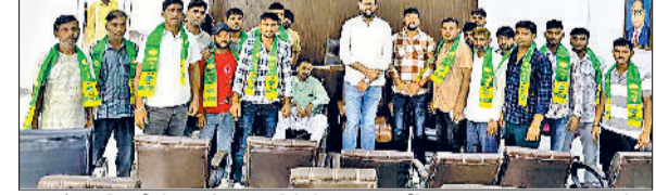
नारनौल। दिल्ली के असोला फार्म में जजपा पार्टी का पटका पहनाकर युवाओं को शामिल करते दिग्विजय चौटाला।